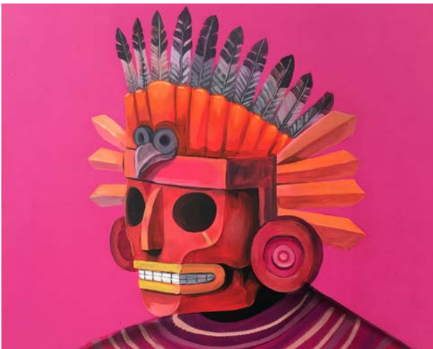
Edgar Flores aka SANER

Edgar «SANER» Flores est un street artist né à Mexico City en 1981, qui s'est démarqué sur la scène graffiti internationale ces dix dernières années avec de grandes fresques murales vives et colorées inspirées du muralisme mexicain. Polyvalent, il est également peintre, illustrateur et graphiste. En 2016 le Museo de las Americas à Denver (USA), lui a consacré une grande exposition personnelle intitulée «Resistencia». Saner représente parfaitement la nouvelle vision, les nouvelles idées et la nouvelle esthétique qui font le pont